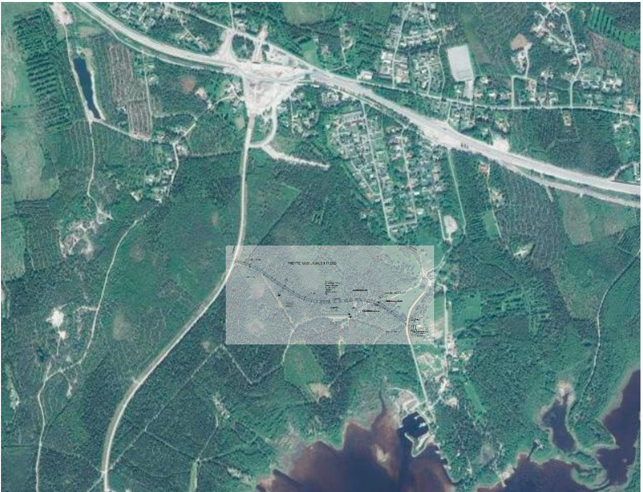
Kuva 1. Suunnittelualueen sijainti.