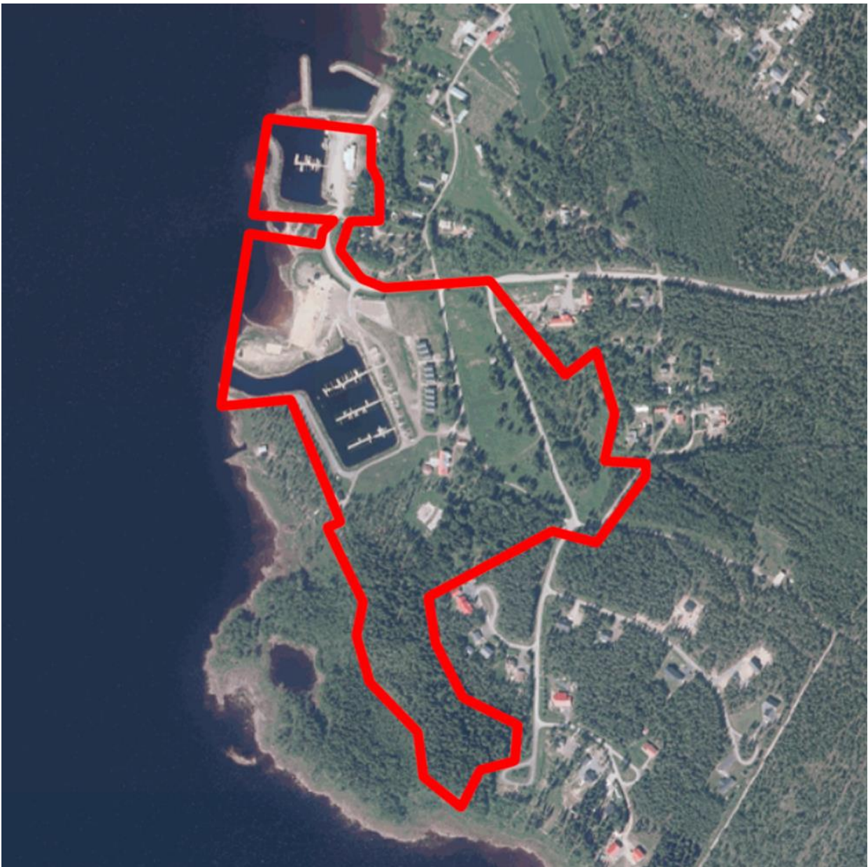
Kuva 1. Suunnittelualan sijainti.

Osallistumis- ja arviointisuunnitelma 20.5.2026